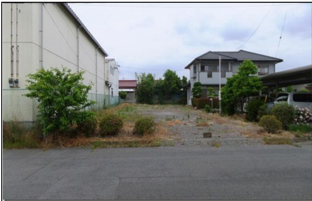
現地写真 平成27年5月撮影

※確定測量後に面積が増減する場合がございます。 ※司法書士は弊社指定となります。 ※資料と現況が相違するときは現況を優先します。