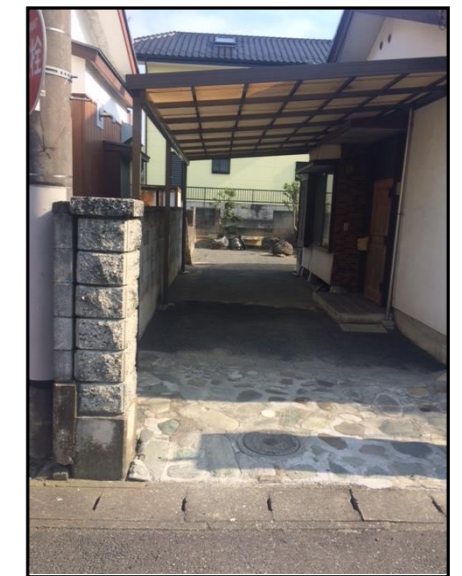
現地写真 平成27年9月撮景